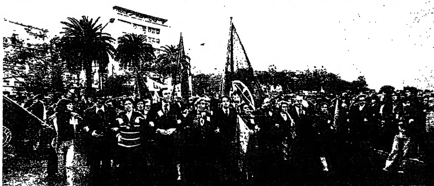
تظاهرة معادية للشيوعية تقودها لافوا